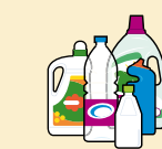
BOUTEILLES - FLACONS EN PLASTIQUE